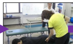
実技習得度チェック