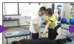
実技運動指導演習